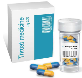
Dispositivi medici - Medical device

Superior 400 by Etipack ensures sharp, reliable printing of barcodes, text and logos, offering excellent abrasion resistance and effective printhead protection. Designed for challenging materials such as uncoated papers and tags, it delivers superior coverage and flawless results even on rough surfaces.