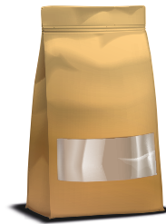
Alimentare - Food