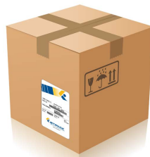
Spedizione - Shipping