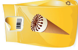
Film per imballaggio - packaging film