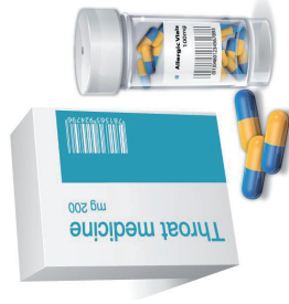
Farmaceutico - Pharmaceutical

Cinisello Balsamo (MI) - Tel. 02 660621 - Fax 02 6174919 - www.etipack.it