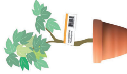
Appl. esterne - Outdoor applications